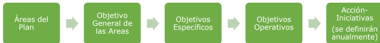
Figura 1: Estructura del Plan Integral de diversidad

Los objetivos se materializarán en iniciativas anuales a través de un anexo al Plan Integral e Diversidad (Plan Anual de la Gestión de la diversidad) de manera que estas se pueden ir adaptando a los cambios legislativos, así como a las demandas y necesidades de la plantilla y la sociedad.